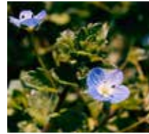
Adi Yavşan Otu ( Veronica hederifolia )