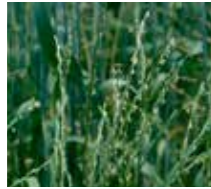
İnce delice ( Lolium rigidum )