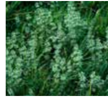
Dil kanatan ( Galium aparine )