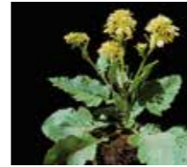
Yabani Hardal ( Sinapis arvensis )