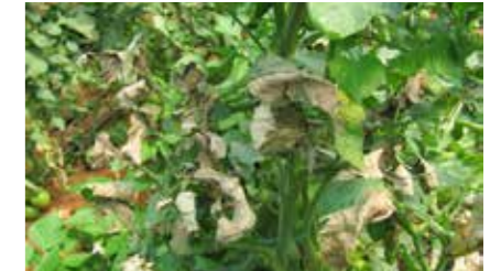
Domates mildiyösü ( Phytophthora infestans )