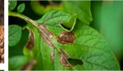
Patateste erken yaprak yanıklığı ( Alternaria solani )