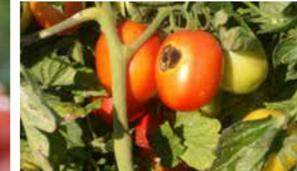
Domateste erken yaprak yanıklığı ( Alternaria solani )