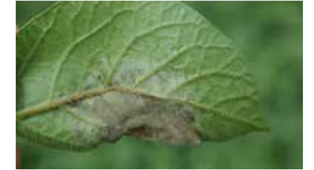
Patates mildiyösü ( Phytophthora infestans )