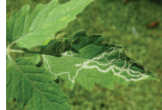
Yaprak galerisineği ( Liriomyza trifolii )