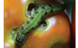
Yeşilkurt ( Helicoverpa armigera )