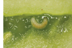
Domates güvesi ( Tuta absoluta )