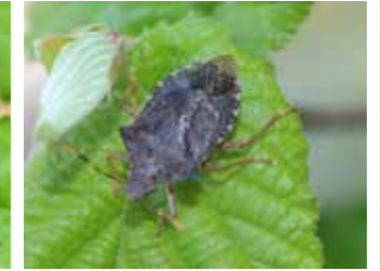
Kahverengi kokarca (Halyomorpha halys)