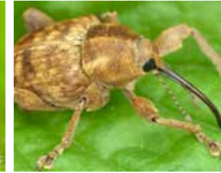
Fındık Kurdu (Curculio nucum)