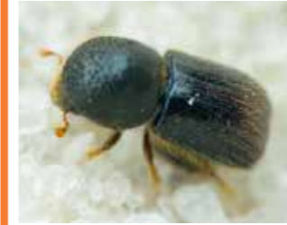
Fındık Dalkıran (Xyleborus dispar)