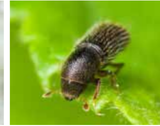
Daldelen (Lymantor coryli)