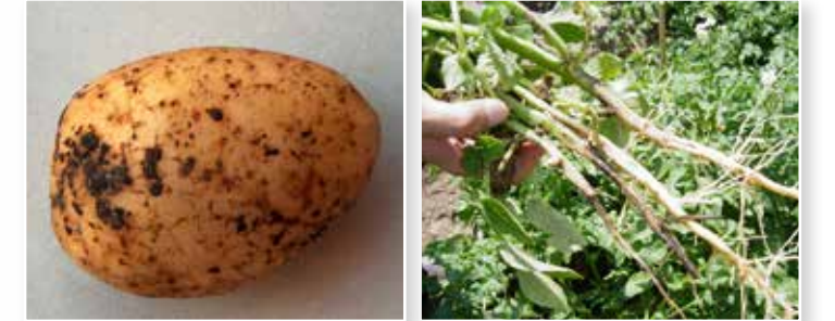
Patatesteki Kökboğazı nekrozu ve Siyah siğil hastalığı ( Rhizoctonia solani )

Celest® 100FS Max 1 litrelik ambajlarda pazara sunulmaktadır.