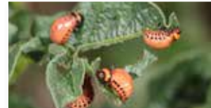
Patates böceği ( Leptinotarsa decemlineata )

Ampligo® 250 ml, 500 ml ve 1 litrelik ambajlarda pazara sunulmaktadır.