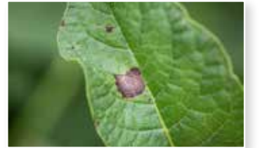
Patates Mildiyö (Phytophthora infestans)