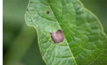
Patates Mildiyö (Phytophthora infestans)