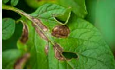
Erken yaprak yanıklığı ( Alternaria solani )