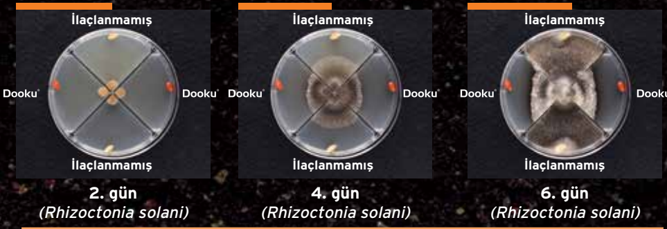
2. gün ( Rhizoctonia solani )