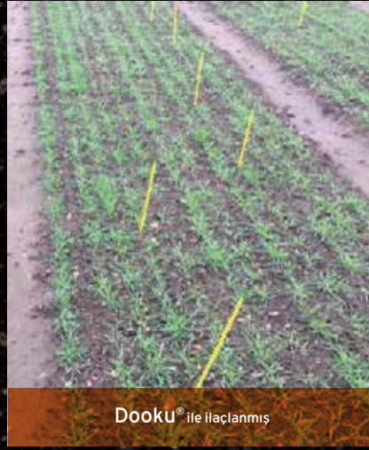
Dooku® ile ilaçlanmış

Sedaxane , geniş etki spektrumu ile Syngenta tarafından sadece Tohum ilaçlamaları için özel olarak geliştirilmiş bir aktif maddedir.