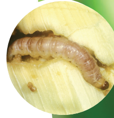
Mısır koçankurdu ( Sesamia spp. )