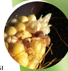
Mısır kurdu ( Ostrinia nubilalis )