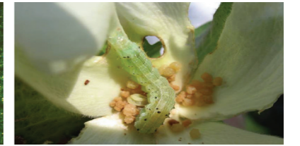
geç dönem larva

zararlının her döneminde uzun süre etkili