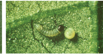
erken dönem larva