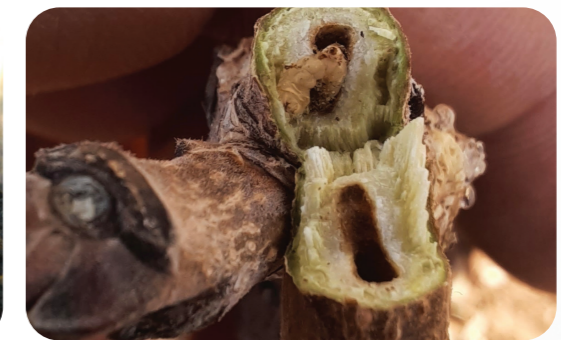
Antepfıstığı dalgüvesi ( Kermania pistaciella )