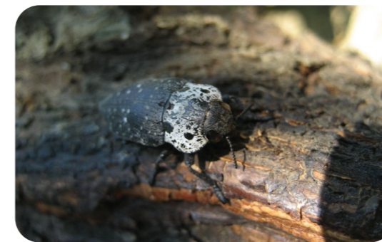
Antepfıstığı dipkurdu ( Capnodis cariosa )