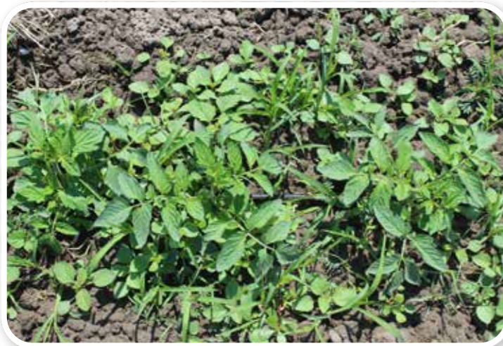
Uygulama Yapılmamış Kontrol Parseli