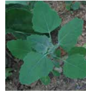
Sirken (Chenopodium album)