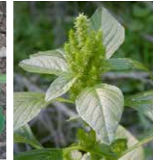
Kırmızı köklü tilki kuyruğu (Amaranthus retroflexus)