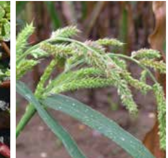
Darıcan (Echinochloa crus-galli)