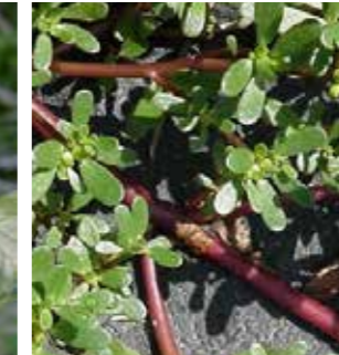
Semizotu (Portulaca oleracea)