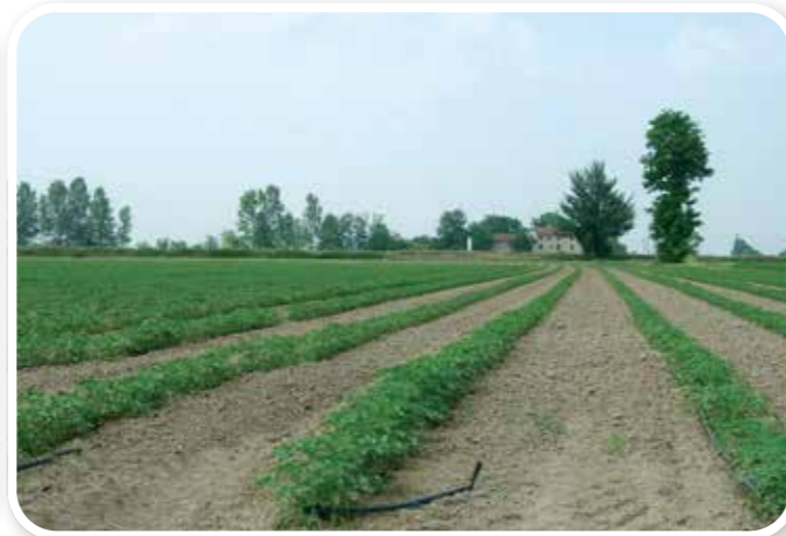
Defi Maxx Uygulanmış Parsel