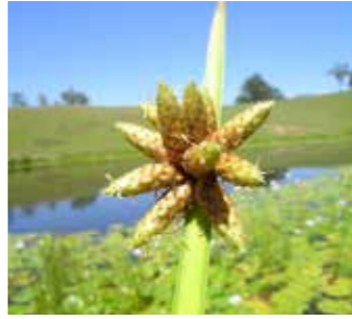
Kındıra ( Scirpus mucronatus )