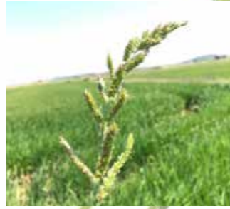
Darıcan ( Echinochloa crus-galli )