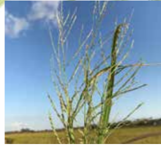
Baraj otu ( Leptochloa fusca )