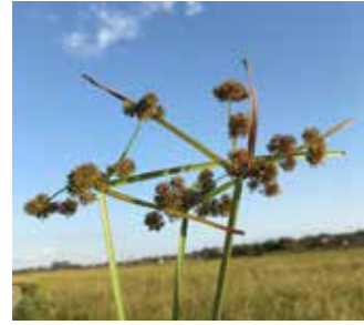
Kız otu ( Cyperus difformis )