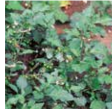
Köpek üzümü ( Solanum nigrum )