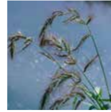
Darcan ( Echinochloe crus-galli )