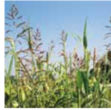
Kanyaş ( Sorghum halepense )