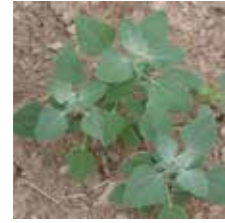
Sirken ( Chenopodium album )