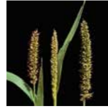
Yapışkan otu ( Setaria verticillata )