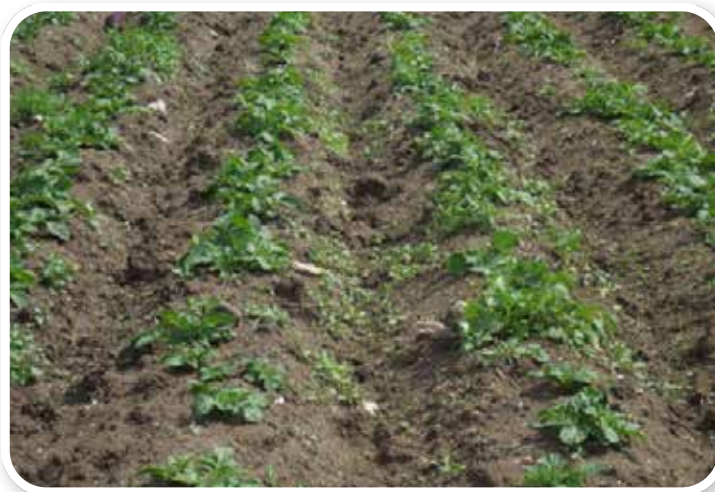
Uygulama Yapılmamış Kontrol Parseli