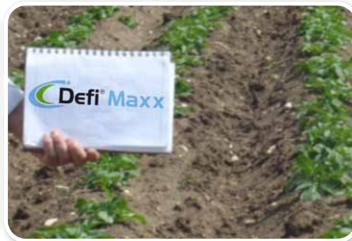
Defi Maxx Uygulanmış Parsel