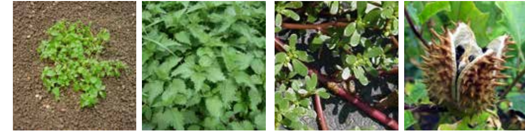
Kuşotu ( Stellaria media ) Isırgan ( Urtica dioica ) Semizotu ( Portulaca oleracea ) Şeytan Elması ( Datura stramonium )