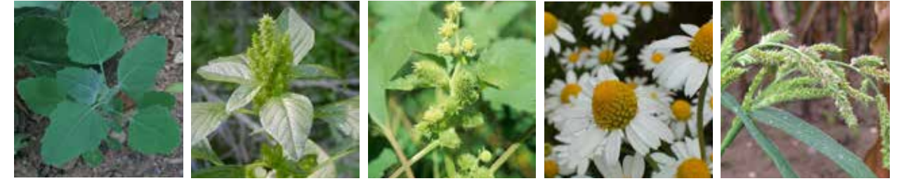
Sirken ( Chenopodium album ) Horoz İbiği ( Amaranthus retroflexus ) Domuz Pıtrağı ( Xanthium strumarium ) Papatya ( Matricaria chamomila ) Darcan ( Echinochloa crus-galli )