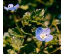
Adi Yavşan Otu ( Veronica hederifolia )