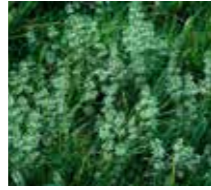
Dil kanatan ( Galium aparine )