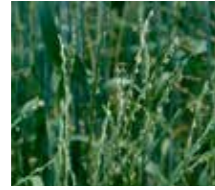
İnce delice ( Lolium rigidum )