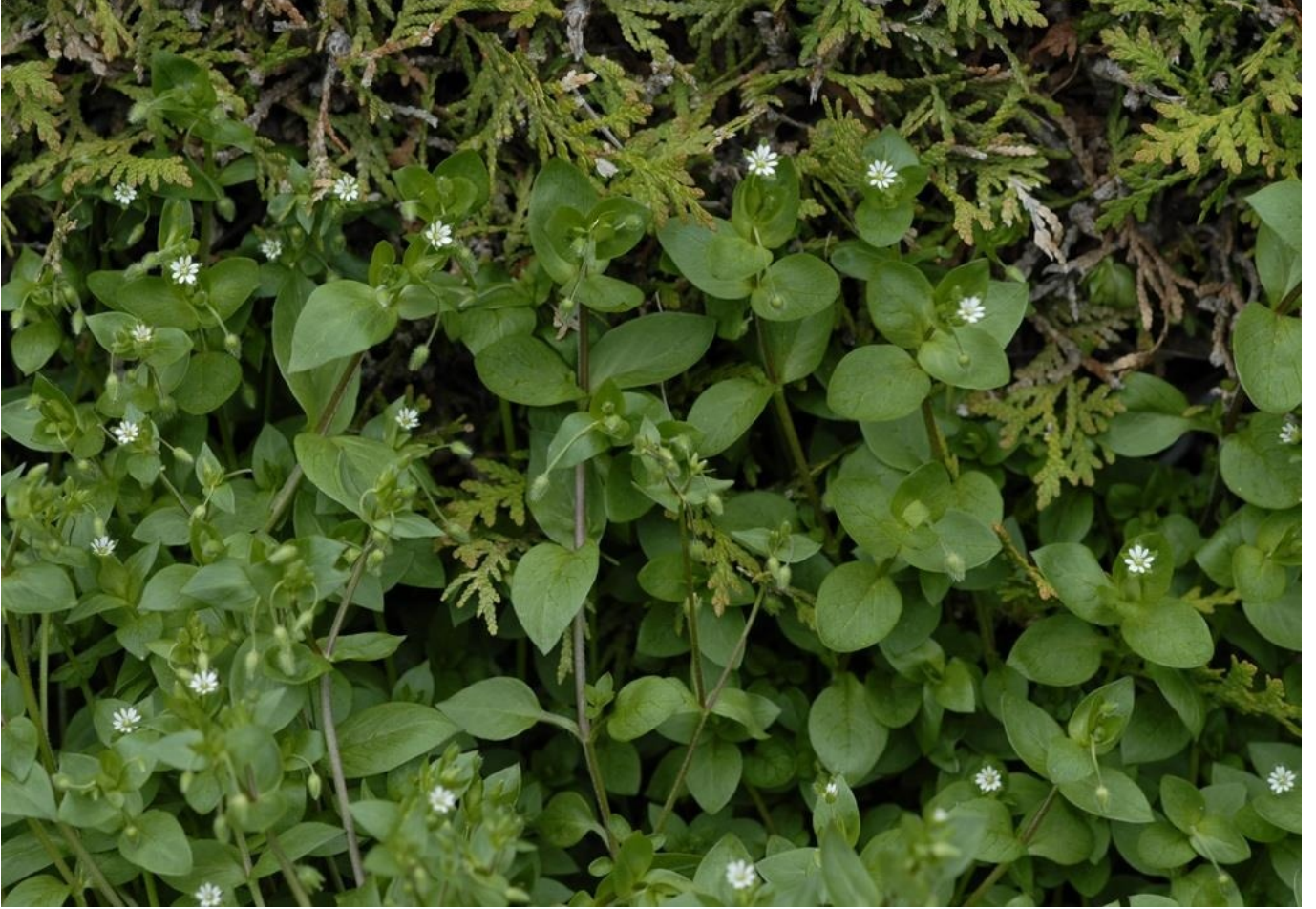
Serçe Dili (Kuş Otu)