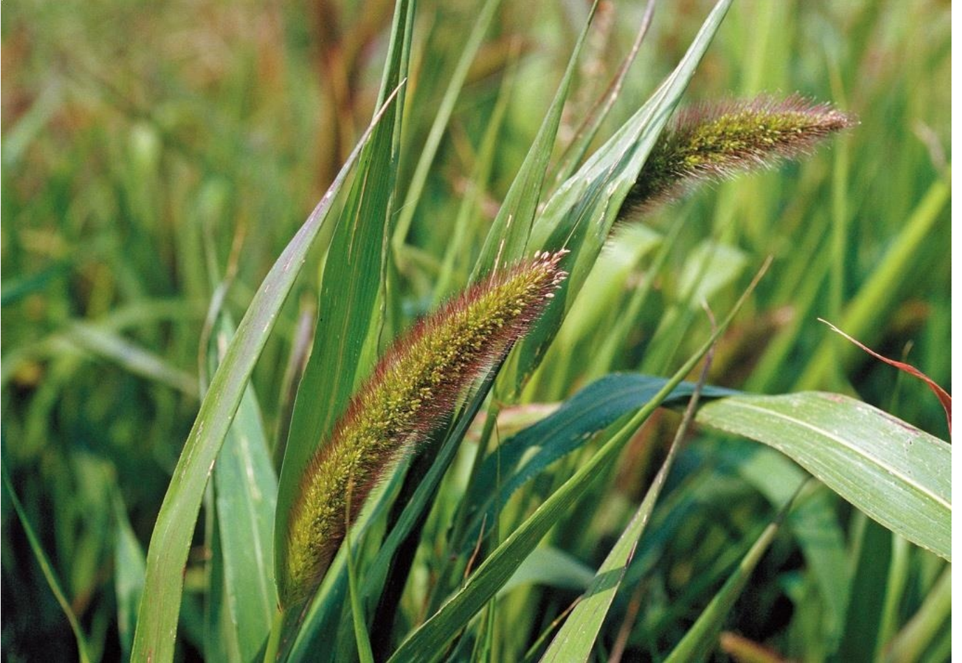
Yeşil Kirpi Darı