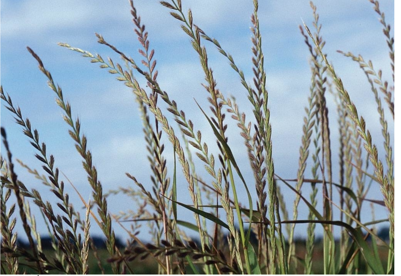
Karaçim (İngiliz Çimi, Karaçayır, Delice)