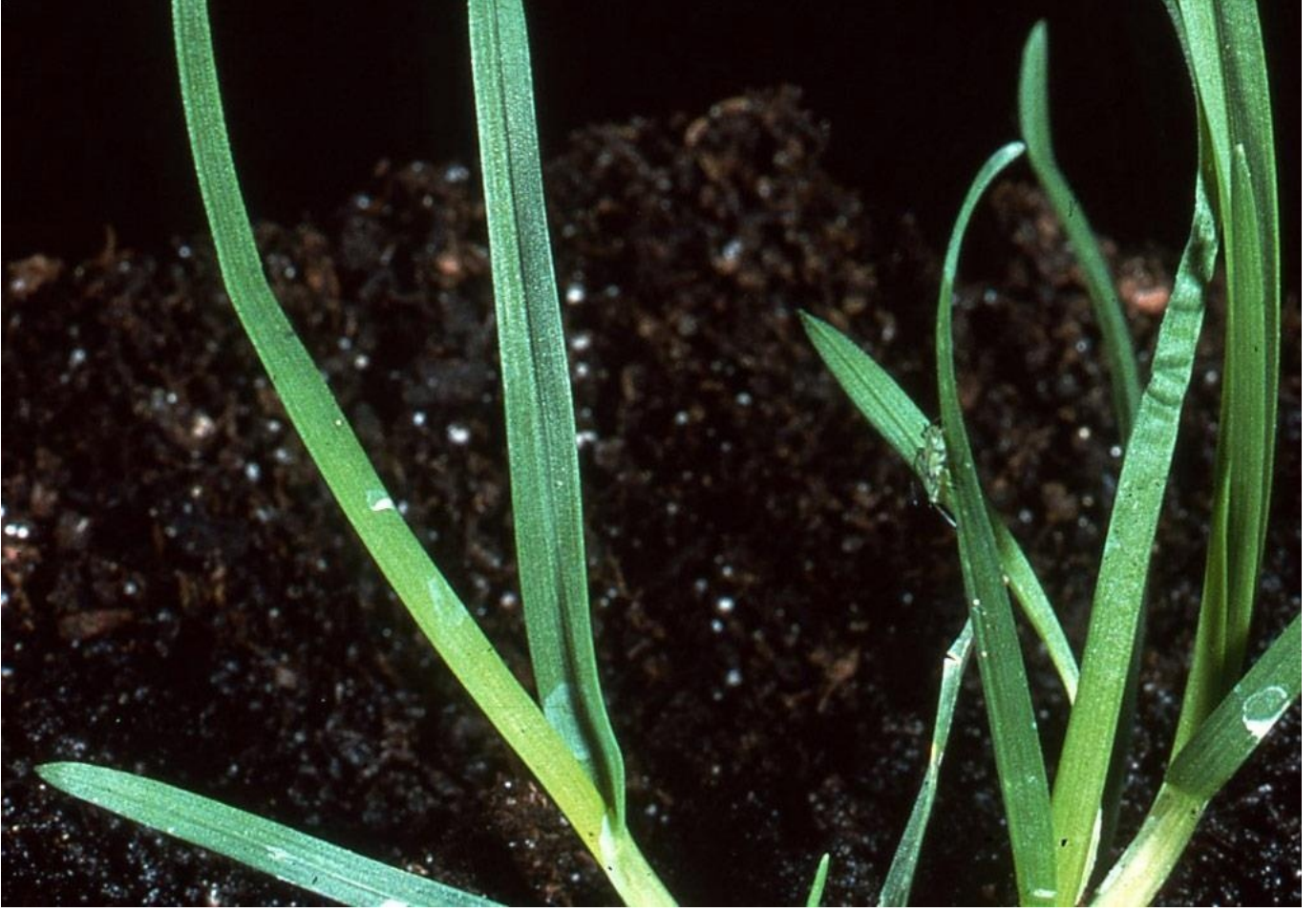
Tavşan Bıyığı (tek yıllık salık otu)