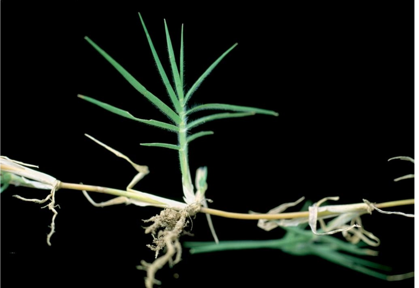
Köpek Dişi Ayırığı