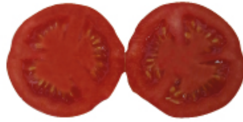
Doğru gübrenilmiş bitki meyvesi (EC)

Aşırı azotlu gübrelemeden kaçınılmalıdır (Şeker, Üre, Nitrat).