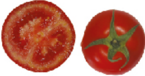
Boş su veya düşük EC' li gübrelemede oluşan meyve