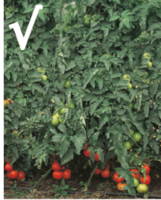
En kaliteli meyve yaprak altında olgunlaşan meyvedir.